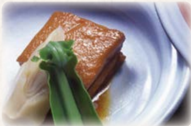
ラフテーと地野菜の煮物