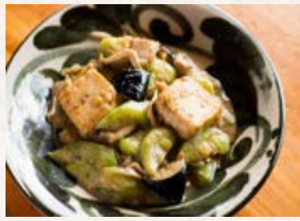
ナーベラーみそいりちー 1,000円