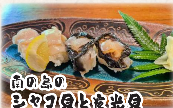
雨の島の しゃぶ貝と夜光貝 の寿司 1,500円