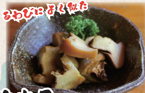
夜光貝やわらか煮