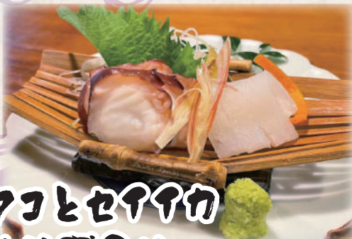
島タコとセイヤカ お造り盛り合せ