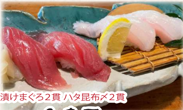
漬けまぐろ2貫 ハタ昆布×2貫 八重寿司 1,100円