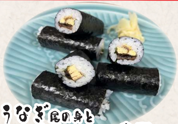
うなぎ尾の身と だし巻玉子の細巻き寿司 1,320円