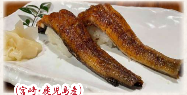
(宮崎・鹿児島産) うなぎ寿司 1,800円