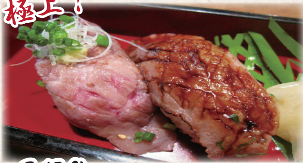
石垣牛 (サーロインorさびとん) 炙り寿司 1,800円