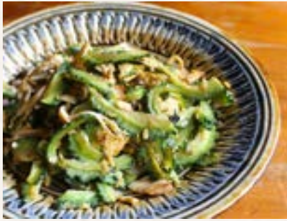
ごーやちゃんぷるー 1,000円