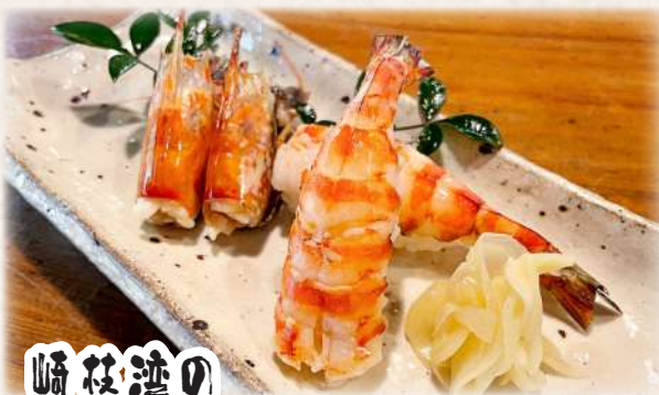
崎枝渡の 車海老しゃぶ寿司 1,320円