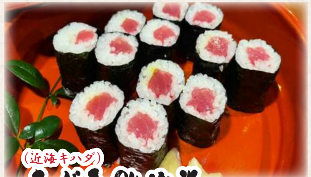
(近海キハダ) まぐろ鉄火巻 1,000円