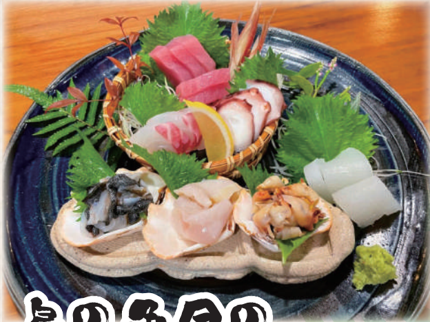
島の魚貝の 盛り合せ